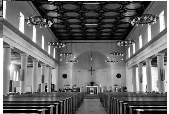
Het interieur van de Mariakerk in 2007, nu gesloopt.