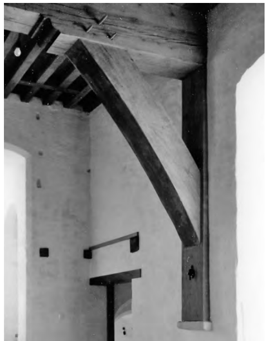
1 'Tweedehands' eikenhouten korbelen stutten het gebinte in de Ridderzaal.

Voor de invulling van het interieur werd de hertenkop op de Kapelzaal gerestaureerd, evenals het schilderij van Arie Lamme . Een eikenhouten dekenkist ►