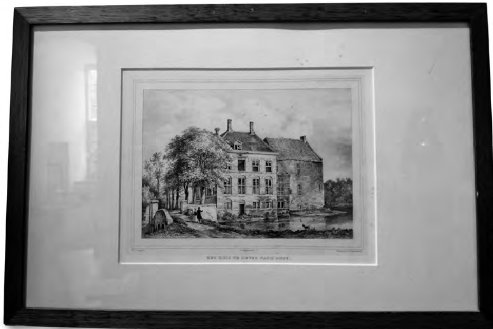
4 De steendruk Het Huis te Dever door P.J. Lutgers, heeft een plaatsje in de Ridderzaal.