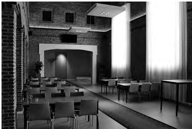
De aula van de school leent zich nu voor kleine afscheidsbijeenkomsten en condoleances. De klaslokalen op de begane grond zijn verbouwd tot besloten rouwkamers.