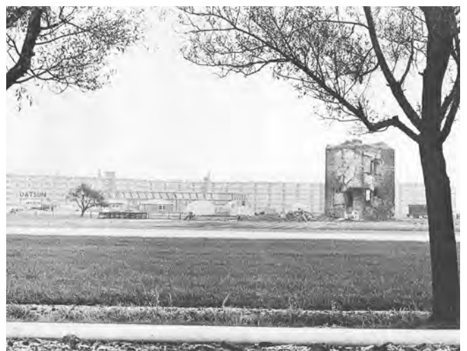
't Huys Dever in 1972, kort voor de restauratie, met de flatgebouwen van het Rembrandtplein erachter