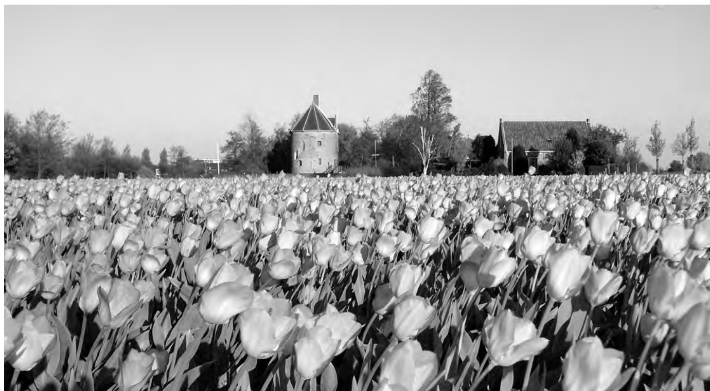
Dever, gezien vanaf de Heereweg, met wuivende tulpen op de voorgrond. Dit is het beeld dat de Vrienden van Dever graag willen behouden.