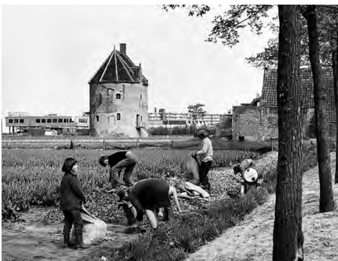
't Huys Dever, direct na de restauratie in 1978, met de nieuwbouw van autoimporteur Datsun er direct achter

en de Heereweg, in het oosten ruikt het bedrijventerrein met hoogbouw op, in het zuiden en westen dreigt het open karakter van de omgeving door bebouwing verloren te gaan. Het resultaat is dat de donjon geheel ingesloten komt te liggen waardoor het monumentale karakter van 't Huys Dever en het omliggende terrein belangrijk zou inboeten aan cultuurhistorische waarde.