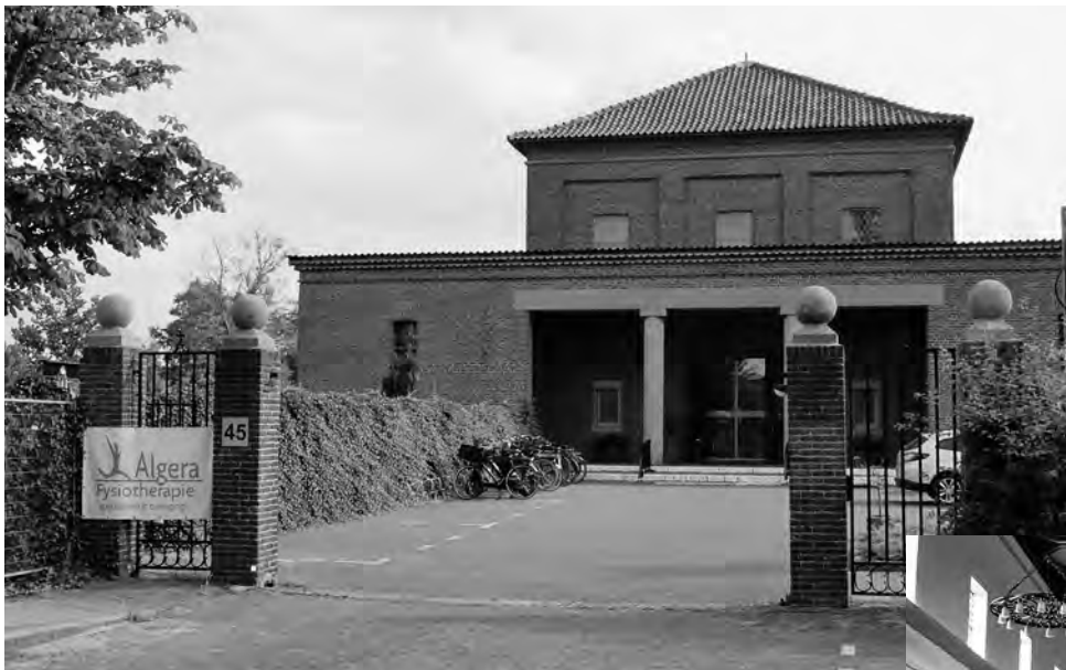
Kerk van het Onbevlekt Hart van Maria (Mariakerk) in Lisse (1950-1952), anno 2018 in gebruik als huisartsen- en fysiotherapie-praktijk.