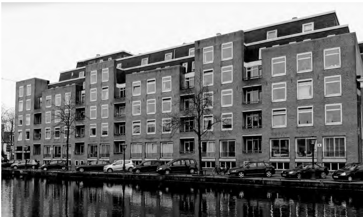
Het studentenhuus Pelikaanhof (1969) in Leiden op de hoek Oude Singel/Pelikaanstraat bestaat uit 560 kamers. Paardekooper gebruikt hier weer traditionele materialen. Ook de hoofdvormen lijken weer meer aan te sluiten bij zijn Bossche periode.

Paardekooper: „Verheijen, inmiddels ook met pensioen, was een moderne architect. Bepaald ►