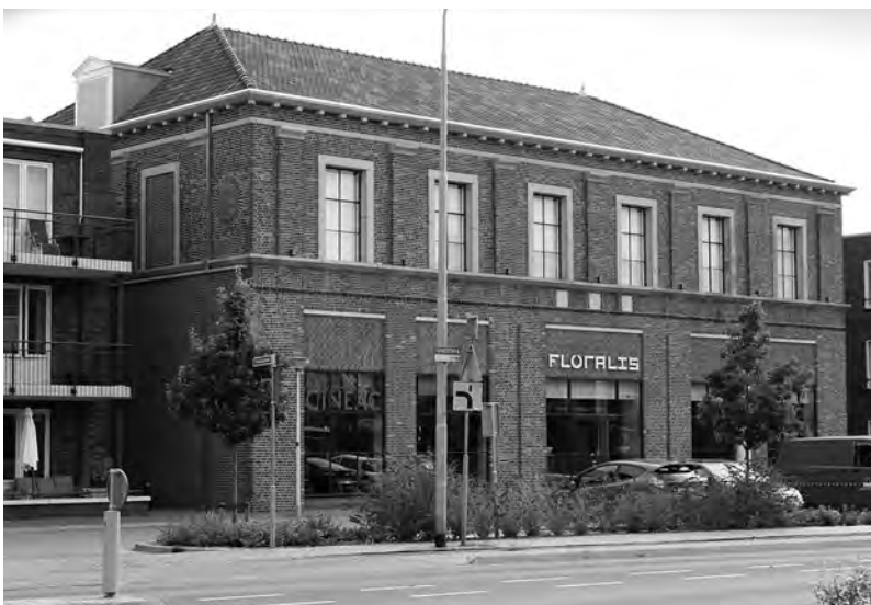
Het voormalige HBG-veilingcomplex met kantoren (1952) aan de Hyacinthenstraat is gedeeltelijk gesloopt om plaats te maken voor woningbouw, maar het hoofdgebouw met mijnzaal is door de gemeente Lisse gerestaureerd en in gebruik genomen als cultureel centrum. De naam van het bioscoop/theatercomplex is Floralis. Het voormalige directiekantoor (om de hoek in de Tulpstraat) is verbouwd tot woonhuis.