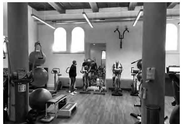
Thans kan men sporten in de 'kerk'.