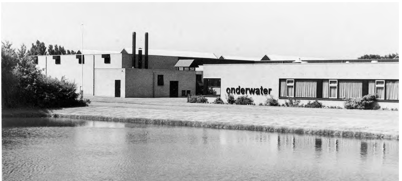
Het bloembollencomplex van de firma Onderwater aan de Lissese Heereweg. Op deze foto is de high tech-uitbreiding links nog niet te zien.