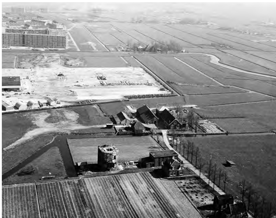
Luchtfoto van Dever tijdens de restauratie van 1978. Hier is het bedrijfsterrein erachter nog in aanbouw. De bloembollen werden tot aan de voet van de steenklomp geteeld.

Het bestuur van Stichting Vrienden van Dever beseft dat een nieuwe fase