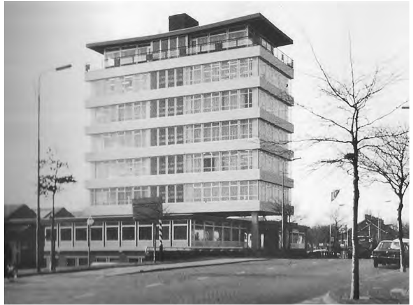
De kantoorflat van Schulte & Lestrade aan de Parklaan in Sassenheim. De flat is in 1999 gesloopt om plaats te maken voor het appartementencomplex Sassemehof.

Begin jaren '70 ontwerpt Paardekooper een complex van bedrijfshallen en kantoren voor het bollenbedrijf Onderwater aan de Lissese Heereweg. De herkenbare hoofdvorm, het gebruik van traditionele materialen en de verbinding met de buitenruimte via de patio-achtige tuinen rond de kantoren en hallen zijn van Paardekooper zelf. De laatste, zuidelijke hal is in de jaren '80 getekend door zijn