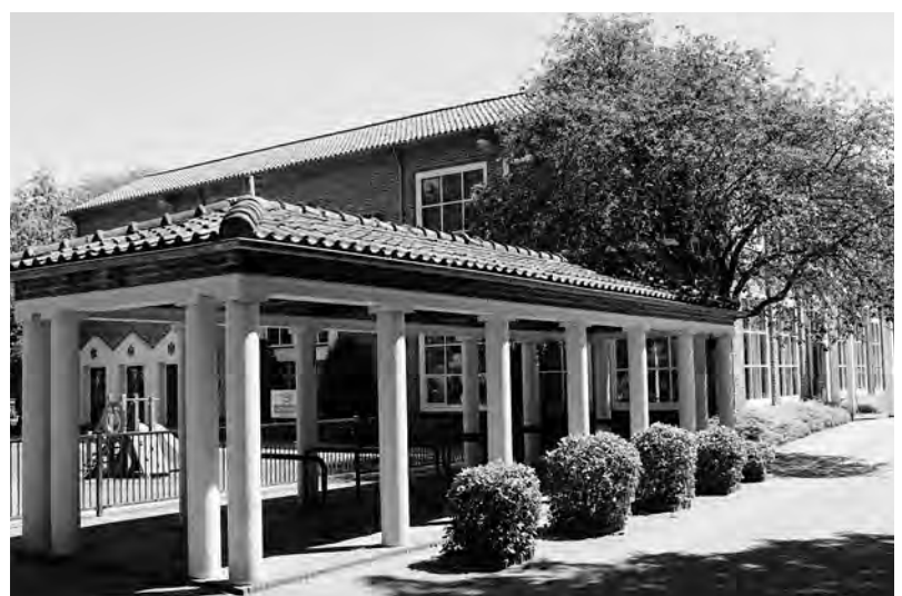
De Hillegomse Johanneschool (1955), op dit moment in gebruik als cultureel centrum en kinderdagverblijf.

In de periode 1950-1960 is er nog genoeg belangstelling voor de Bossche School. Paardekooper bouwt de Willibrord-ULO in Noordwijk, scholen in ►