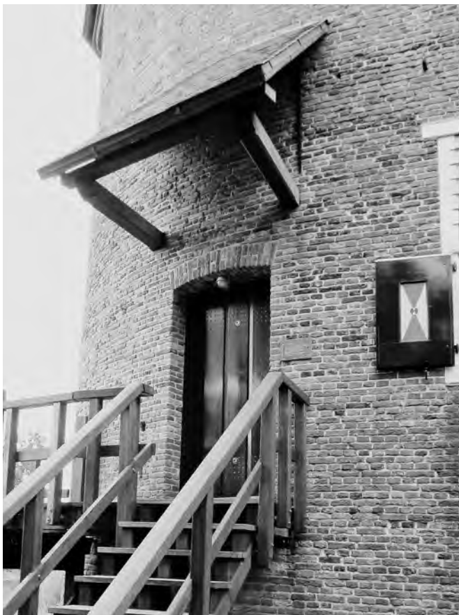
5 Het afdak boven de ingang houdt bezoekers droog.